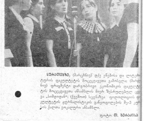
სურათზე: (მარცხნივ) დე ენებისა და ლიტერატურის ფესტივალის მოცეკვეთა გამოცეკვა (მარჯვნივ) ფრანგული დარგობრივი ეკონომიკის ფესტივალის მოცეკვეთა ანანდიის მიერ შესრულებულ ცეკვა „სიმოდან“ (ქვემოთ) სცენაზე ფილოსოფიის ფესტივალის სურნალისტიკის განყოფილების მე-9 კურსის ქალთა ვოკალური ანსამბლი.

ჩვენს დროში უდიდესი საქმეა იმის გარჩევა, თუ მრავალ წიგნთა შორის რომელს მივუძღვიო ჩვენს ცნობიერებაში ადგილი. ფუჭი წიგნი ვერ გვიწავლებს დროის იმ ნაკვეთს, რომელიც ჩვენ მასზე დავხარჯეთ. მაგრამ შეიძლება ვიპოვიო ისეთი მეგობარი — მასწავლებელი-წიგნი, რომელიც ცოცხალი ბრენ-კაცივით გვიხმობდავანდელი. უდიდესი ბედნიერებაა ასეთი წიგნის პოვნა, თუ ახალგაზრდა ტალანტი ვაჩინა, რომელიც გამჭვირვალე ინტერესებითაა გაშუქებული, იგი როგორც მანძილი კვიშაში დაფარული რაინის ნაქვეცხლს, თეოდეი იპოვის თავისი ინტერესების მოსახუბრებებს, ან იმ კაცს, რომელიც ამ წიგნებს ათვინებს.