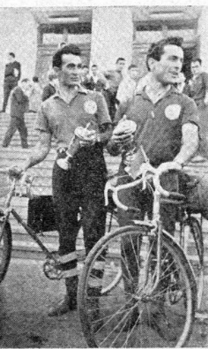
აი ისინი, ჩვენი უნივერსიტეტის ფილოლოგიის ფაქტობრივი ნაწილობრივი განყოფილებების სტუდენტები, რომლებიან ველო-ტურისტულ მოგზაურობის მონაწილეები — გაცნა მანია და ზურ ფოთა. სწრაფი გადაღებულია 30 სექტემბრის, უნივერსიტეტის ცენტრში, ტრისტიული ვაჭრობის დასრულების შემდეგ.

თავისი შედეგი გამოიღო. მეტივერა შეიქმნა ჩვენი კომიტეტის წევრთა მიერ სასწავლებლებში წესრიგის დარღვევის შემთხვევების აღმოფხვრის მიზნით. როგორც ვხედავთ, რეკტორატის, პარტიული და ალკ კომიტეტების დახმარებით ჩვენს კომისიის მიერ გაწეული მუშაობა სასწავლებლო შედეგები მოუტოვა, მაგრამ ეს იმას არ ნიშნავს, რომ ამომ უკვლავური დამარჯვება ჩვენი ვალთა შეგარბურით მიღებული შედეგები, არ შეგარბურით მუშაობა, ესხვალდ გვეტირის თვითი უკვლავური არაქანსად გამოვლენისამდე და დროს აღმოფხვრება იგი, გვეტირის აღმოფხვრის მიზნით შეიქმნა და გარეთ, როც. ე. პაბინიძე, სანიშნო დისკომისიის დადგენის კომისიის თავმჯდომარე.