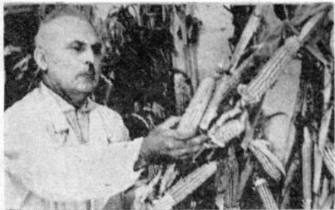
ჩვენი მეცნიერები კოლექტივში ახალი მიღწევებით, სამეცნიერო შრომებით, გამოკვლევებით შეხვდა უნივერსიტეტის პარტიულ ორგანიზაციას. მის მიერ გამოყვანილი სიმბოლო ახალი წარმატებითაა დატვირთული. მისი მიერ დატვირთული სიმბოლო ახალი წარმატებითაა დატვირთული. მისი მიერ დატვირთული სიმბოლო ახალი წარმატებითაა დატვირთული.

სულ უფრო და უფრო განიცდის ჩვენი უნივერსიტეტი ამ მხარე აღსანიშნავი 12-სართულიანი სასწავლო კორპუსის აგება, რომლის შედგენილობაც მომავალ წელს უნდა დაიწყოს.