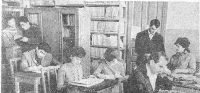
მეცნიერ-მეთოდის ფაკულტეტის სამკიხელოში მენეჯერ-თანამშრომლები, ასპირანტები, მათე-მატიკით დაინტერესებული წარჩინებული სტუდენტები ცნობიან, სწავლობენ უახლეს მათემატიკურ ლიტერატურას, აქ ამისათვის ყველა პირობაა შექმნილი. სტრატია: სამკიხელოს დარბაზში.