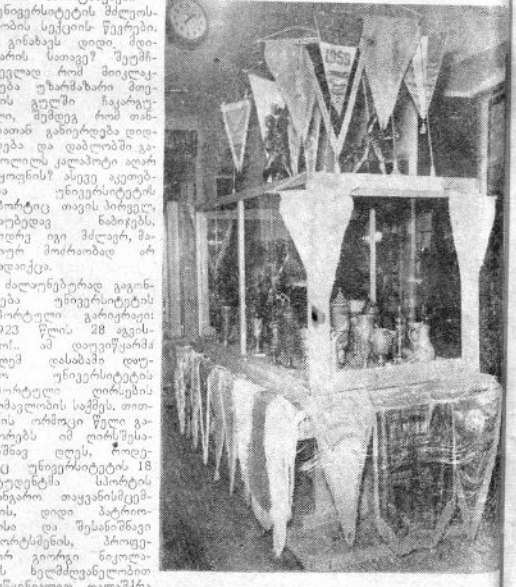
რედაქტორი ირ. შიშინაძე