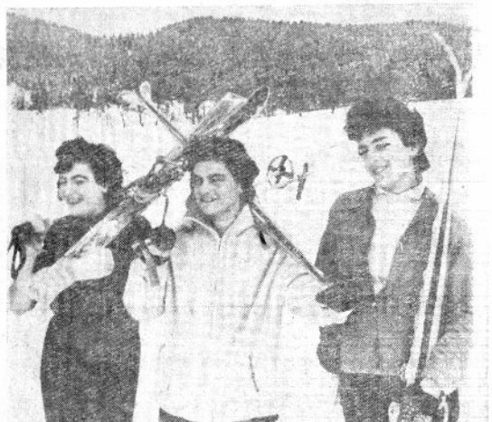
თბილამურბაში ბასიჩინანის შეჯიბრება ფოტომატიუდი ზურაბ რუსანიანი

გამარჯვებულბს გადაეცათ სიგელები და ფსონი საწვრთნები.