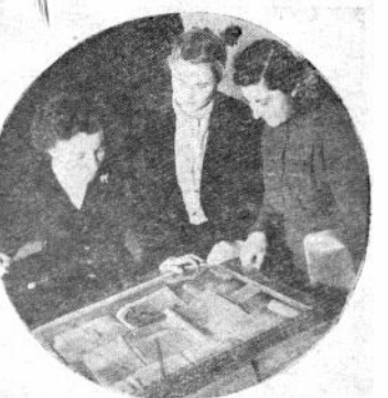
წარმოადგინა და მსახველი სტატიათა გამოფენის დროს დაინტერესებულნი.

რუსი, აზერბაიჯანელი, სომეხი და ქართული ხალხების ლიტერატურული ურთიერთობისადმი მიძღვნილ სამეცნიერო სესიასთან დაკავშირებით ჩვენი უნივერსიტეტის სამეცნიერო ბიბლიოთეკამ მოაწყო დიდი გამოფენა. გვტყვიან უხვად იყო წარმოდგენილი აღნიშნული ლიტერატურული ურთიერთობის მსახველი სამეცნიერო, პოპულარული და თარგმნითი მხატვრული ლიტერატურა რუსულ, აზერბაიჯანულ, სომეხურ და ქართულ ენებზე, აგრეთვე ბევრი საფრანგული სტატია. გამოფენამ სესიის მი-