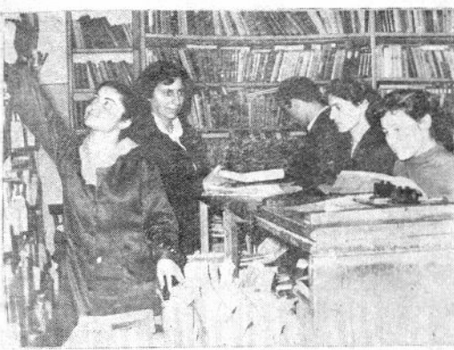
გამოდების ცხარე დღეებია. უნივერსიტეტის ყველა კოხტში დაბნული შეშაბა. განსაკუთრებით სტუდენტთა სამკითხველ დარბაზში აგრძობს ეს დარბაზის თანამშრომლები შეუსვენებლად ემსახურებიან სტუდენტებს, დღოდღე მათ კარგ შედეგს მიაღწიან.

სურათში: პირველი კორპუსის სამკითხველ დარბაზის თანამშრომლები სტუდენტთა მომსახურების დროს.