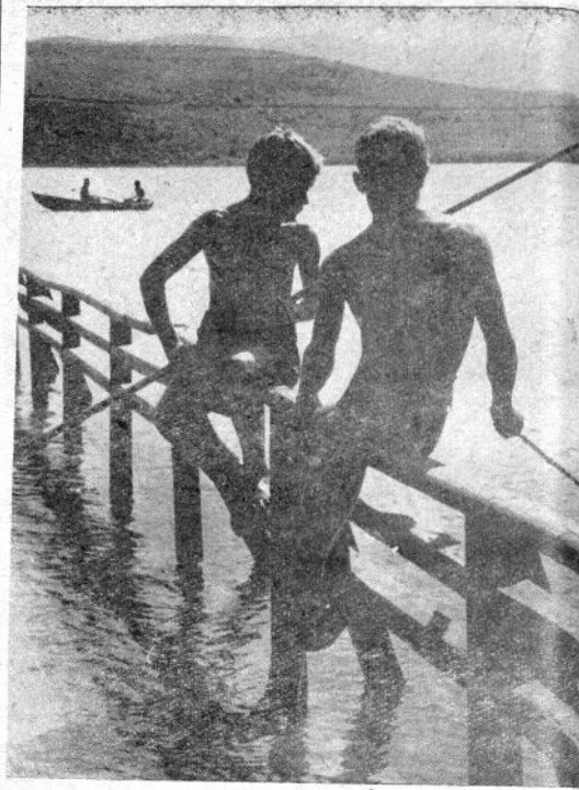
თ ი მ გ რ ბ ა ვ ო რ ტ ო ტ ო ლ ე გ. გ ა მ ბ ე ნ ი ა ა

ასეთი ვეებერთელა ზარის ჩამოსმის იმის ვეებერთელა, თუ რა მულედონეზე იდგა მშინდელ რუსეთში შეტარებია.