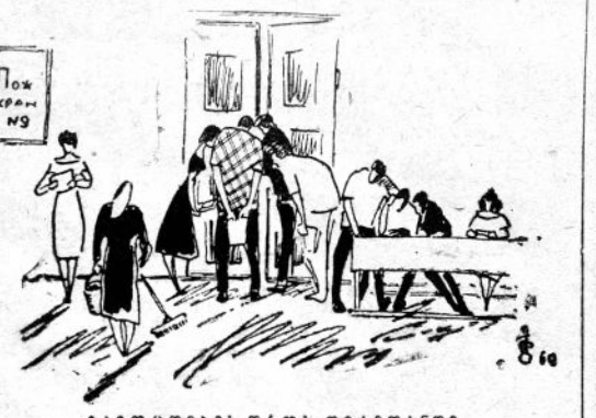
გამომცემის დროს დარბანანი