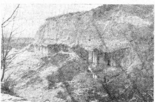
ფანსისტთა ყოფილი ბასტიონი. აქ სამი თვის განმავლობაში განუწყვეტელი ბრძოლები მიმდინარეობდა.

ორი პოპრუონტალური შავი ხაზი მიწა ყოფილა, ორი ვერტიკალური კლანდო ხაზით გარემორტყმული — დამ მიცვევირის ძველი. ჩვენ უკვე დავალეთ პირები, რომ გვეთქვა — ახას, რათა გამოგვებნა ჩვენი აღფრთოვანება, მაგრამ კიდევ კარგი დროზე შევჩერდით, რადგან ამით სრულ უცოდინარობას გამოვამდგანებდით. თურმე ეს ორი ხაზი არის მიცვევირის მხოლოდ თავიანთი და, წარმოიღვიწით, აღფრთოვანება უთავო მიცვევირით. თავი, ბატონო, ავერ გვერდზე ყოფილა: ნახევარწრე, ორი წერტილი, ხაზი და კიდევ წერტილი, გარშემო ისევ წერტილი შავი ხაზები. ხაზების ამ აურზაურში კი ბოცი წითელი და მწვანე ფერები. ეს კი ქალები გახლავთ, რომლებიც ყვავილებით ამკობენ მიცვევირის ძეგლს.