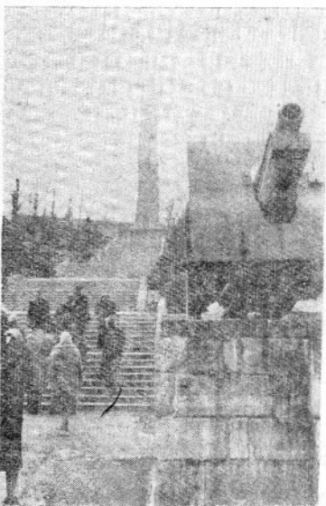
მათა სასაფლავო პოზიანის მახლობლად.

ჩვენმა სახეებმა, ალბათ, ისეთი გამოძეგვებილი მიიღეს, რომ მასპინძლებმა თვითონ იმქარეს თხსნათ: