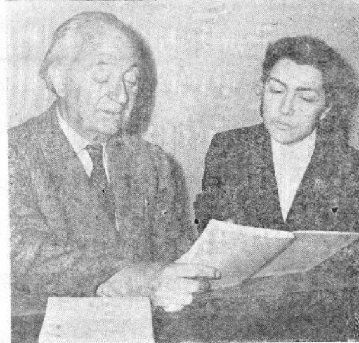
სწრაბთმა: ფილოლოგიის ფაკულტეტის III კურსის ფრიალსანი სტუდენტის...