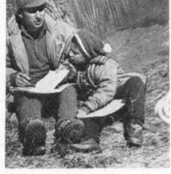
გვებლად უწყობს ნაბიჯს ყოველდღიურობას. მისი უმცროსი ვაჟი პატარაობიდანვე მამის კვალს მიჰყვება.

იმ ღლიც ჭოდიან შევეყვითი ქაუბნისაქენ მიხვდა ორმოცოერი ბოლოც. აღმასწავლებლის წებული სახლების ბანკზე ნილიბიბიტი ჩამოსხმის ბანკისგან ჩამოქვებული გოგონაკები დაუფრყარი ცნობისმყოფრებით მომგვარკეროდენ. ქაქაქალი ქაუბნის მამაკაციური კახულებითი შეტყარო ხეცური დედააკები დაწებებ ქაუბნის იწყაკუნებდენ ხლებს. მათი უწყობა დიდას ვგვარობდა. მათთან გახასხას ერთ რამდგვარიანს, მაგრამ ცაზე მოკრუსუნეს სადგარი ღრუბელი ვეცაქვანა და უყინად მიხვდა ქაუბნის ცაქს კვალდავლი მიყვებოიოთ. ქაუბნის კვდა ნაინარტრები აფრჩიეთ ღამის გასათვიე ადგილი. გაწემა, მაგრამ მალევე გამოიღარა. გათიხებულმა მზემ ნაწეომარ აფრღობს ოხმევიარა ადინა, სხვათიქი ერთობს ადინა, ხოლო, უშმაა! გამოფენის ღლიც არსი დახმასარა. იგი ჩვენი უნივერსიტეტის ფი-