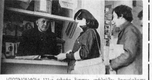
„სტრუქტურალის“ 171-ე ვიხური მადლიე კორპუსში მითავსებული კოსიკური მხილვი ქუნიია კარგად ემსახურება მითხებულის. სწარმოც: მ. შიშივაძე (მარცხენი) ახალ ურნაღ-გაზეთებს ურჩევს მითხებულის.