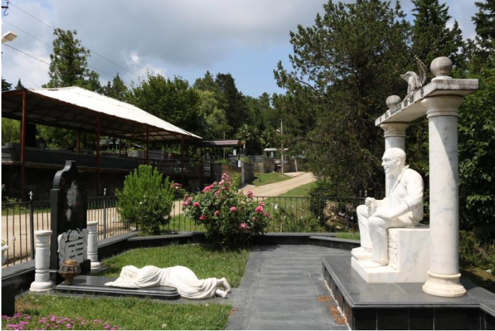
ფოტო N1. გია მანაგაძის სასაფლაო ქუთაისში, 2013.