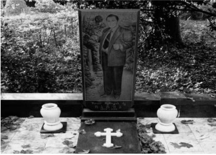
ფოტო N3. შოთა გაგუას საფლავი ხონში, 2014.