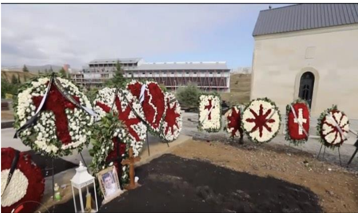
ფოტო N2. კახა “გალსკი” ფარფალიას სასაფლაო საბურთალოზე, 2023 წ. 26 დეკემბერი.