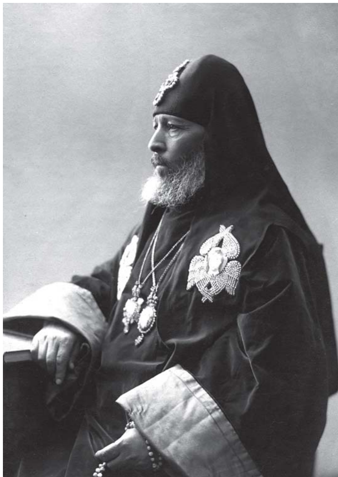
სრულიად საქართველოს კათოლიკოს-პატრიარქი უწმიდესი და უნეტარესი კირიონ II 1917 წ.