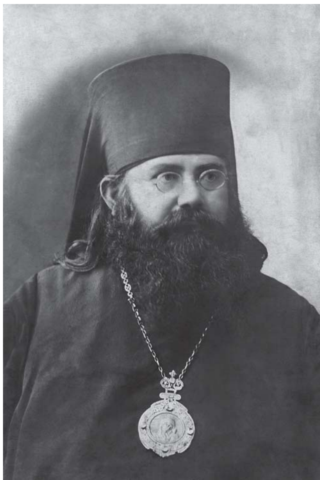
გპინსკოპოსნი პიროსნი (თქროპირიძე) 1917 წ.