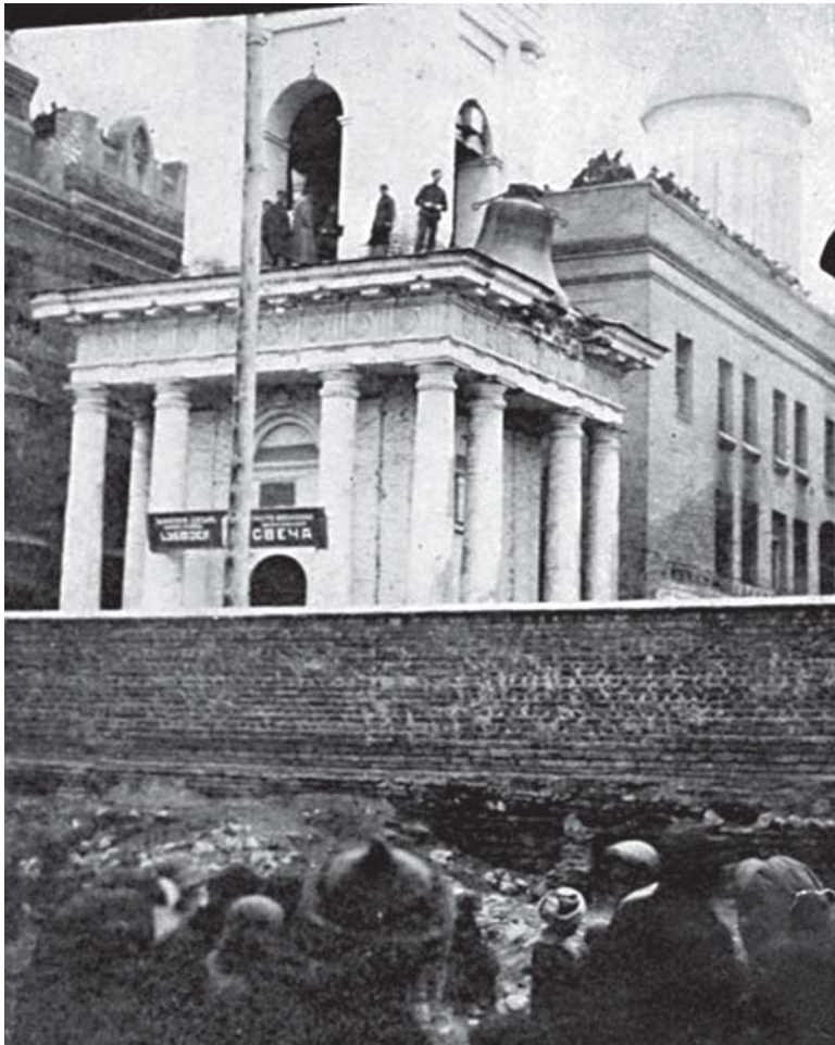
სიონის საპატრიარქო ტაძრიდან ზარის ჩამოხსნა