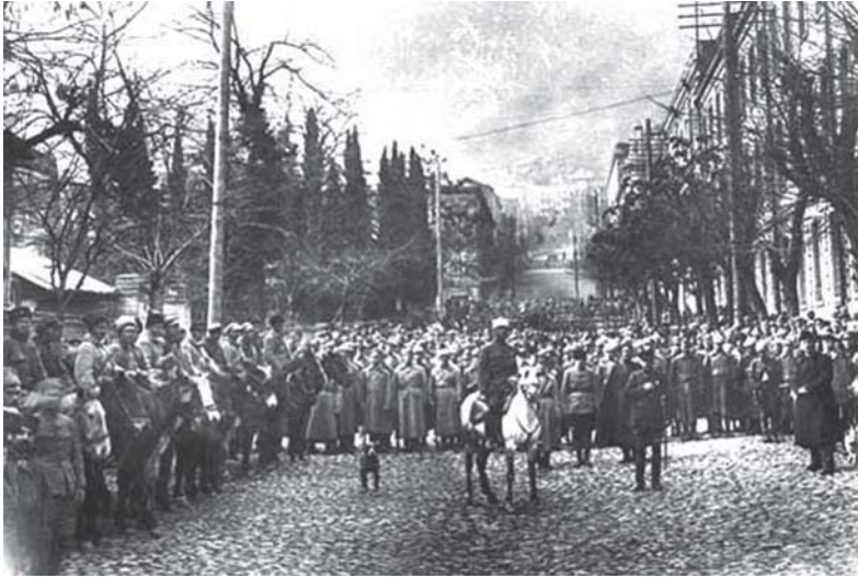
ბოლშევიკური საოკუპაციო მე-11 არმიის ნაწილები თბილისის ქუჩებში 1921 წლის 25 თებერვალი