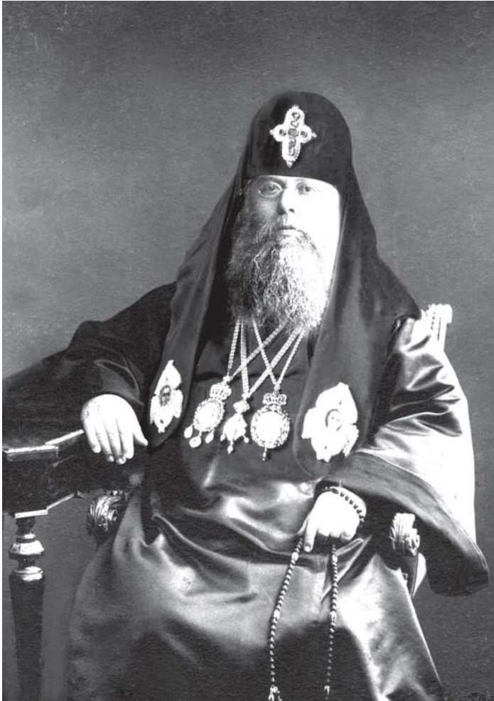
სრულიად საქართველოს კათოლიკოს-პატრიარქი უწმიდესი და უნეტარესი ლეონიდე 1919 წ.