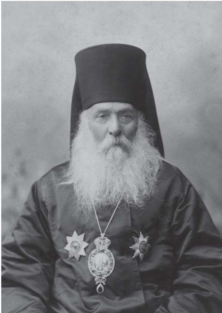
ეპისკოპოსი ალექსანდრე (ოქროპირიძე) 1905 წ.