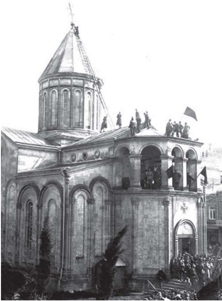
ქუთაისის წმ. დავით აღმაშენებლის ტაძრის გუმბათიდან ჯერის ჩამოსხნა, ბოლშევიკური დროშის აღმართვა 1922 წ.