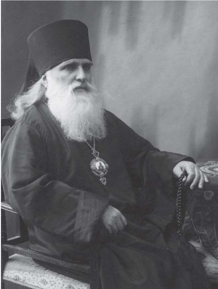
ცხუმ-ბედიელი მიტროპოლიტი ამბროსი 1921 წ.