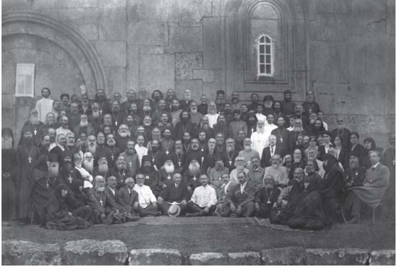
მე-3 საეკლესიო კრების მონაწილენი 1921 წლის 5 სექტემბერი გელათი