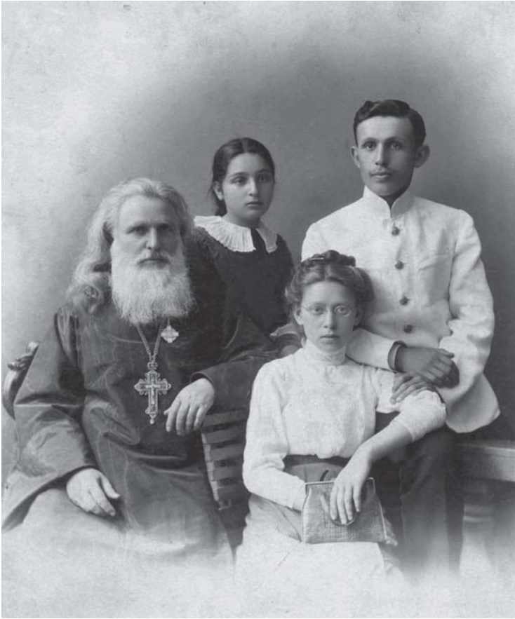
არქიმანდრიტი ამბროსი შვილებთან ერთად 1906 წ.