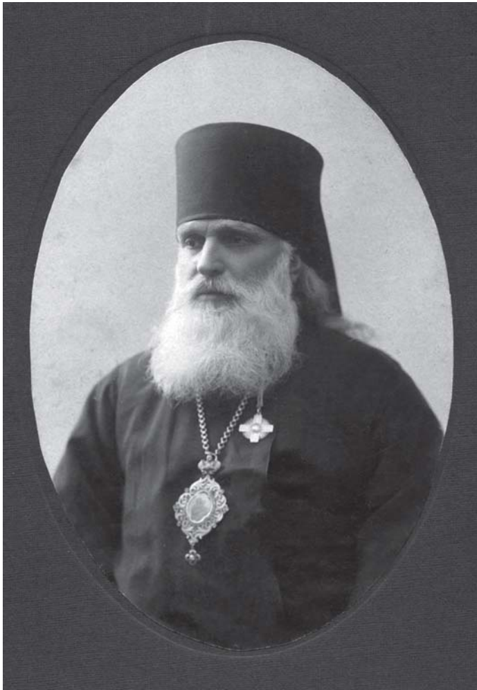
ჭყონდიდელი მიტროპოლიტი ამბროსი 1917 წ.