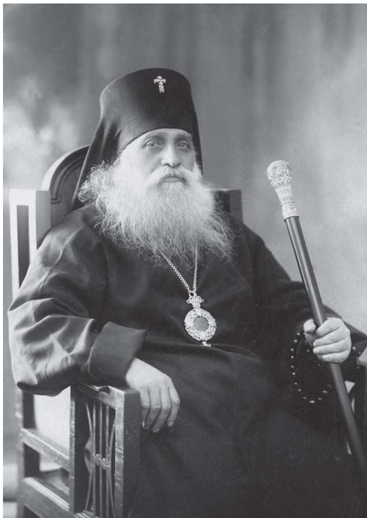
ქუთათელი მიტროპოლიტი ნაზარი (ლეჟავა) 1924 წ.