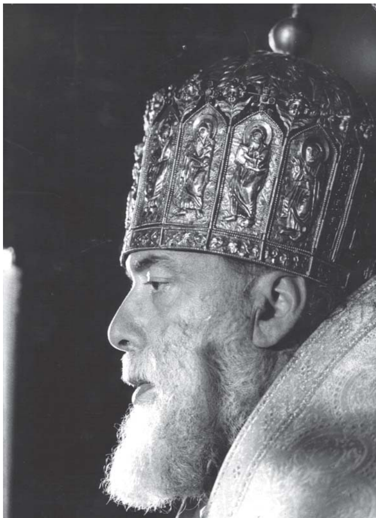
სრულიად საქართველოს კათოლიკოს-პატრიარქი უწმიდესი და უნეტარესი ილია II 1995 წ.