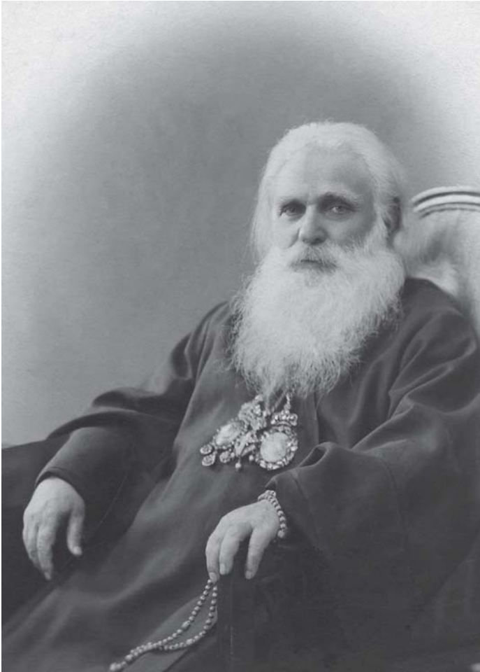
სრულიად საქართველოს კათოლიკოს-პატრიარქი უწმიდესი და უნეტარესი ამბროსი 1925 წ.