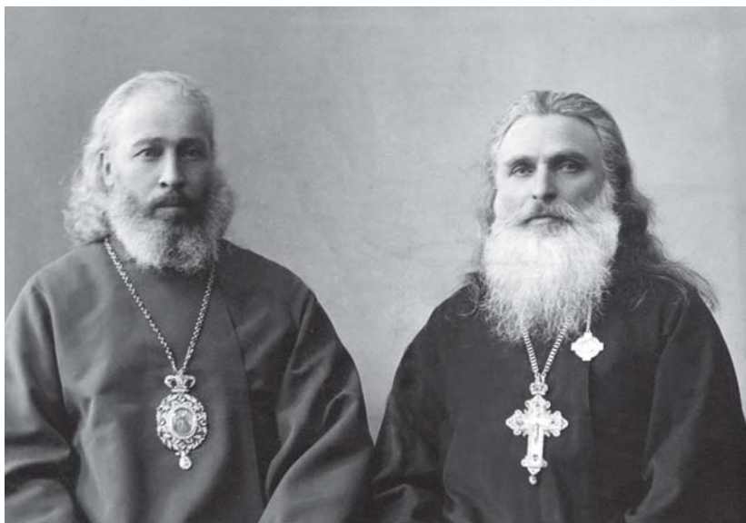
ეპისკოპოსი კირიონი (საძაგლიშვილი) არქიმანდრიტი ამბროსი (ხელაია) 1906 წ.