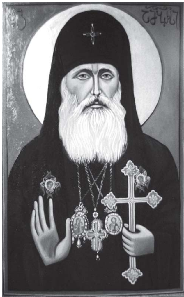
წმიდა ამბროსი აღმსარებელი