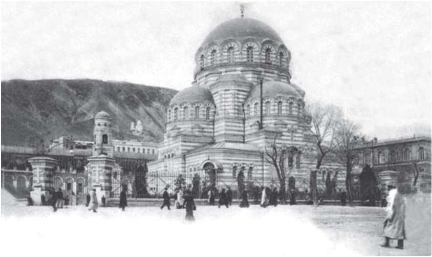
თბილისის სამხედრო ტაძარი, რომლის ეზოში დაკრძალულ იყვნენ კოჯრის გმირები. (ახლანდელი პარლამენტის შენობის ადგილზე) 1924 წ.