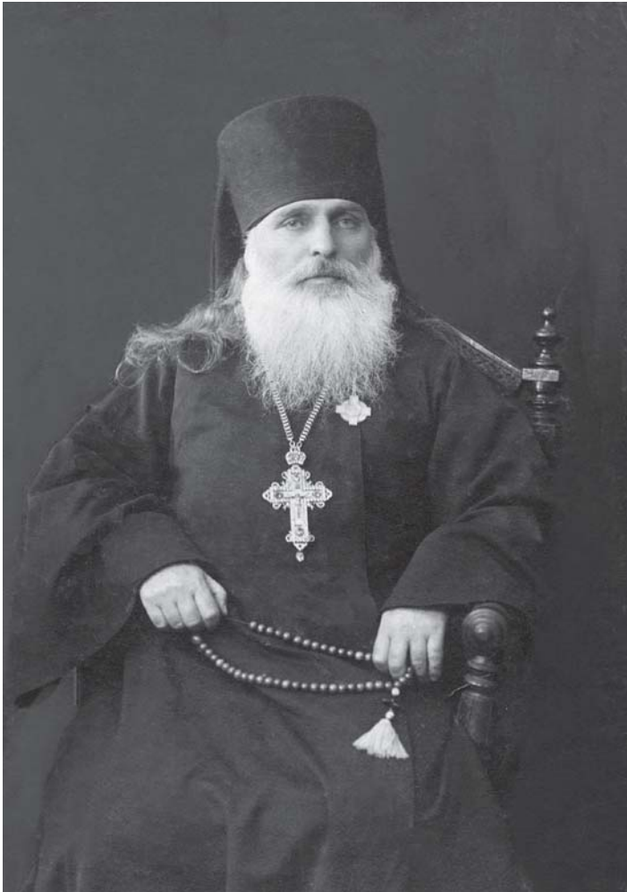
მღვდელმონაზონი ამბროსი 1901 წ.