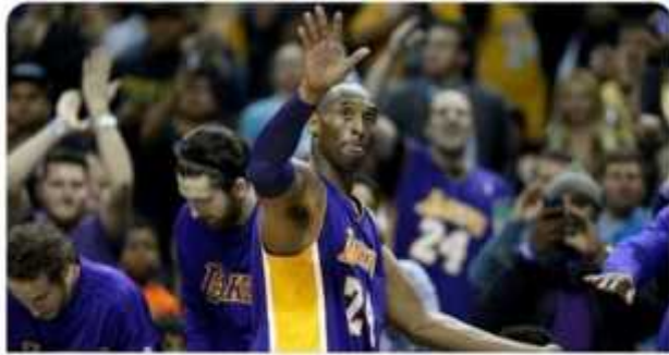
Kobe Bryant's Disturbing Rape Case: The DNA Evidence, the Accuser's Story, and the Half-... thedailybeast.com

შვილთნ ერთად „ვაშინგტონ პოსტის“ ჟურნალისტმა ფელციას სონმენზმა საკუთარ ტვიტერზე 2003 წლის ამბავი გაიხსენა დ გააზიარა 2016 წელს გამოქვეყნებულ სტატია შეწყვეტილ სასამართლო პროცესზე, რომელიც კობი ბრაინტის მხრიდან ახალაზრდ ქალს გაუბატოფრების ბრალდებას ეხებოდა (Abrams & Tracy, 2020).