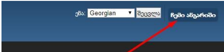
სურათი #1. მკითხველის პირად ელექტრონულ პროფილში შესვლა