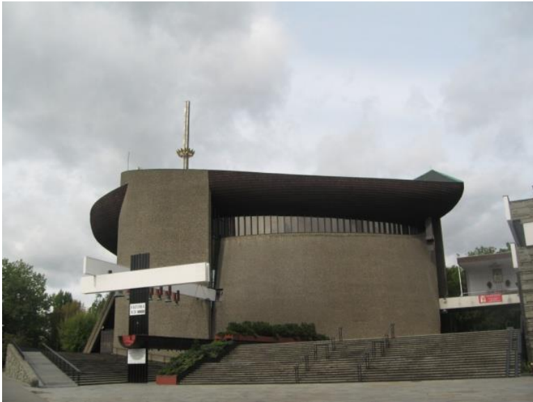
ტაძარი კიდობანი ნოვა ჰუტაში (1976), კრაკოვი, 2010 წელი